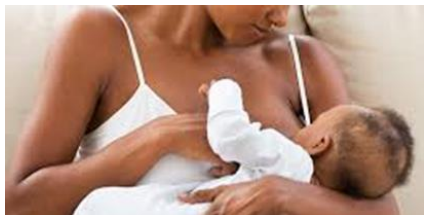
Vertical – da mãe para o filho, principalmente durante a amamentação.