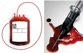
Parenteral – transfusão de sangue e compartilhamento de seringas ou perfurocortantes infectados.