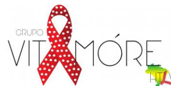
Rio de Janeiro - Rio de Janeiro Site: http://vitamore.com.br/