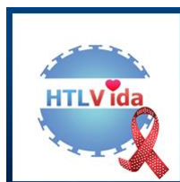
Salvador – Bahia Site: http://www.htlvda.org